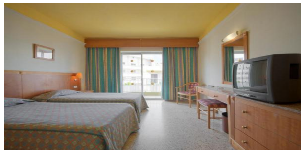
Club Residenz Bugibba Zimmer