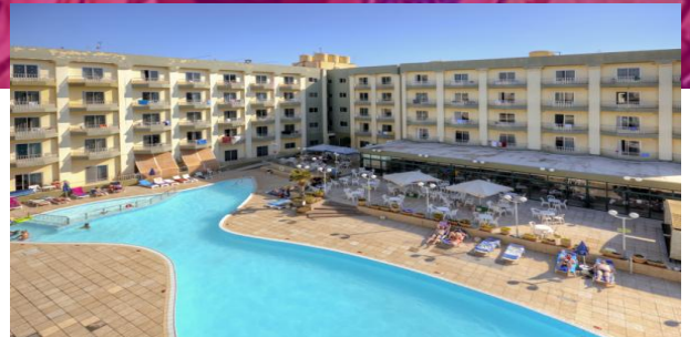
Club Residenz Bugibba Pool

Das Hotel bietet euch mit Vollpension eine Rundumverpflegung. Diese besteht aus Frühstück und Abendessen, welches ihr im Hotel einnehmt und einem Lunchpaket für die Pause in der Schule. Dort könnt ihr während der Mittagszeit gemeinsam mit euren neuen Freunden essen und entspannen.