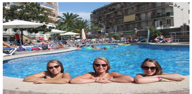
Kühlt euch im Pool ab