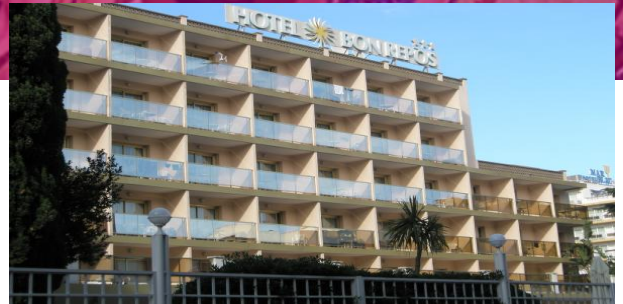
Das Hotel von außen

NEU für euch: Die All inclusive Verpflegung beginnt gleich bei der Ankunft und endet bei der Abreise!