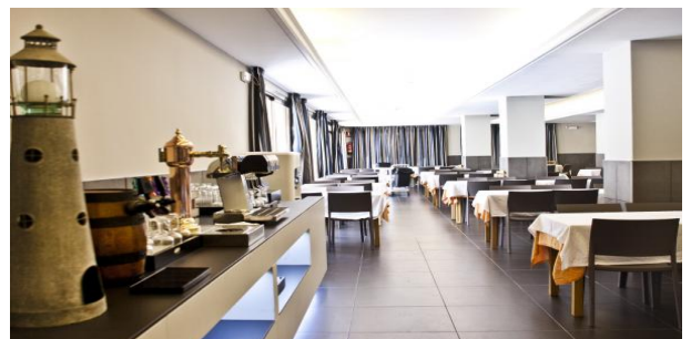
Das hoteleigene Restaurant